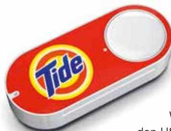
Dash-Buttons von Amazon.