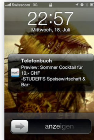
Virtuelle Pinnwand in der deals@kkiosk-App

Foursquare, der Branchenprimus unter den location-based Services, ermöglicht es Unternehmen seit Neuestem, ihre Kunden rasch und flexibel über Sonderaktionen oder Events zu informieren. Wem diese «Local Updates» angezeigt werden, steuert ein Algorithmus, der auf dem aktuellen Standort und auf früheren Check-ins beim Unternehmen basiert.