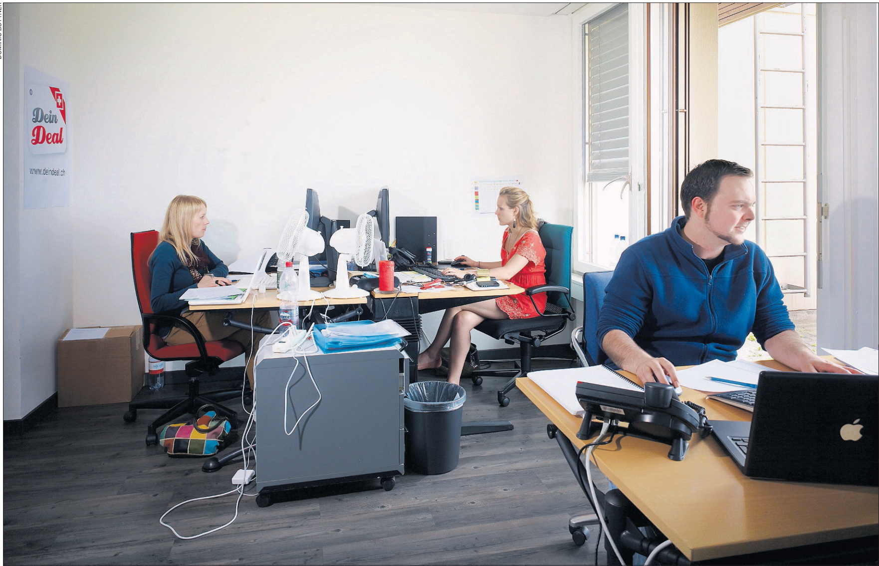
Büro von Dein Deal in Zürich: Das Unternehmen wurde vor einem Jahr gegründet und zählt bereits über 80 Mitarbeitende. (6. 6. 2011)

Der Schweizer Online-Handel blüht wie nie zuvor: Internet-Shops setzten letztes Jahr 8,7 Mrd. Fr. um, wie die jüngste Studie «Schweizer Online-Handel» der Universität St. Gallen zeigt. Dies entspricht einem Wachstum von fast 50% seit 2008. Zu den Gewinnern zählen auch Anbieter, deren Verkaufsmodelle auf das Web 2.0 und die Facebook-Generation zugeschnitten sind. In diese Social Commerce oder Social Shopping genannte Kategorie gehören diverse Spielarten dieses Modells. Gemein ist ihnen, dass sie mit massiven Rabatten locken.